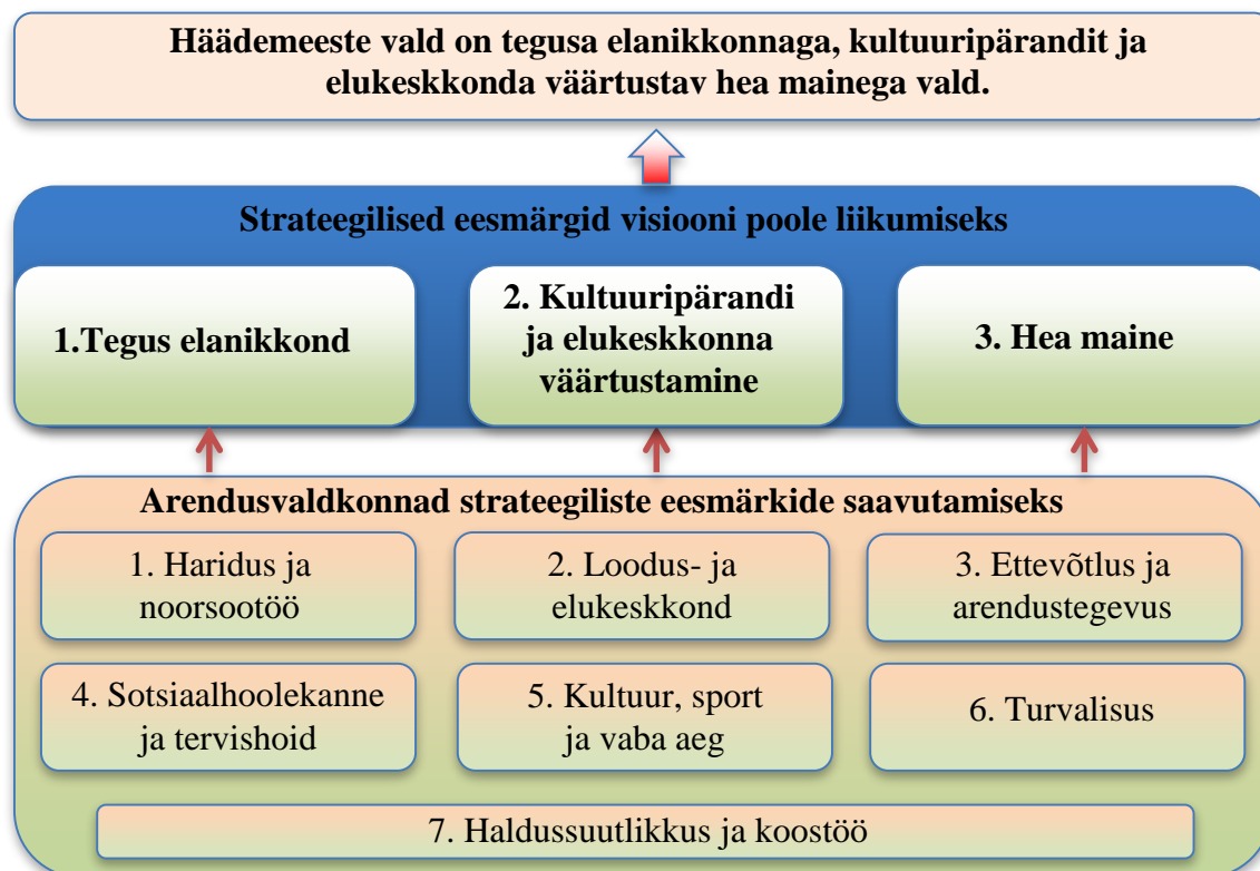
Joonis 1. Häädemeeste valla arengumudel

Häädemeeste valla arengumudel illustreerib seda, millised on strateegilised eesmärgid visiooni poole liikumiseks ja millega tuleb tegeleda strateegiliste eesmärkide saavutamiseks.