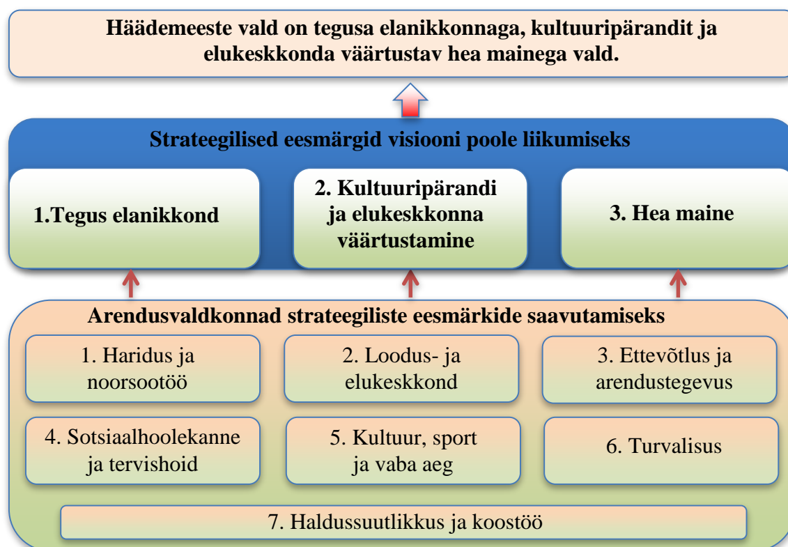
Joonis 1. Häädemeeste valla arengumudel

Häädemeeste valla arengumudel illustreerib seda, millised on strateegilised eesmärgid visiooni poole liikumiseks ja millega tuleb tegeleda strateegiliste eesmärkide saavutamiseks.