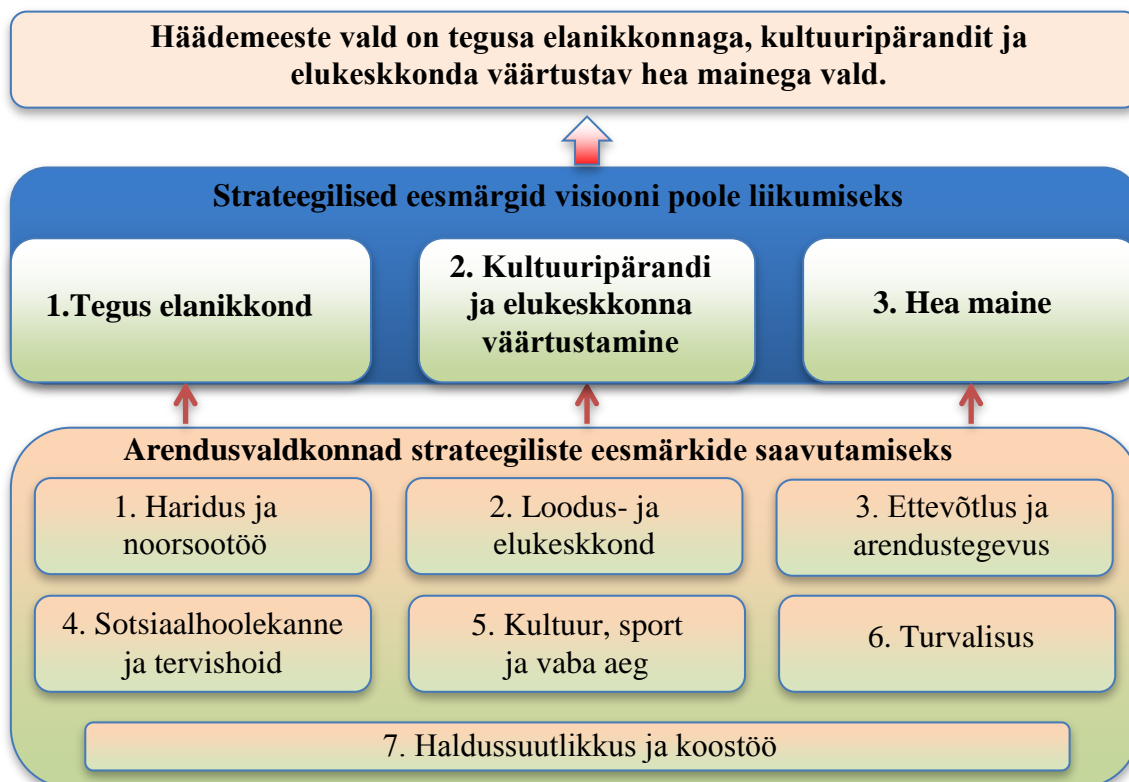
Joonis 1. Häädemeeste valla arengumudel

Häädemeeste valla arengumudel illustreerib seda, millised on strateegilised eesmärgid visiooni poole liikumiseks ja millega tuleb tegeleda strateegiliste eesmärkide saavutamiseks.