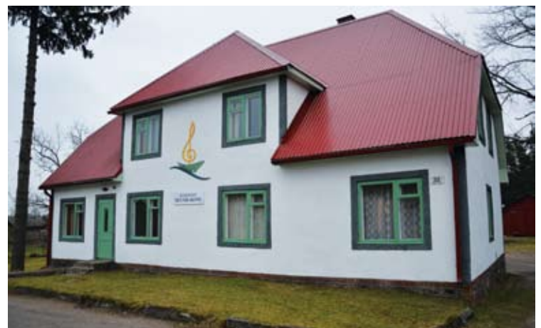
Vallamaja ja muusikakooli hooned.